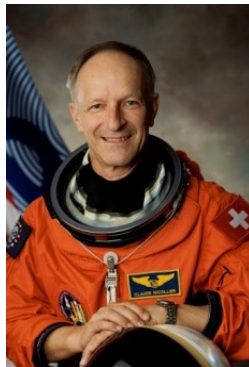
Claude Nicollier Astronaut, Prof. EPFL