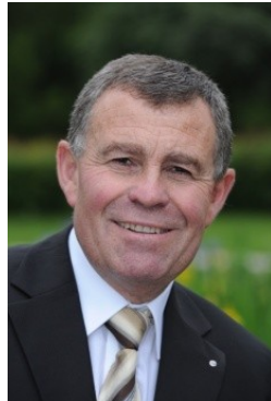
Ernst Stocker Regierungsrat Kanton Zürich